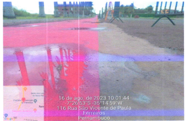
16 de ago. de 2023 10:01:44 -7°26'53" S -35°14'59" W 116 Rua São Vicente de Paula Ferreiros Pernambuco