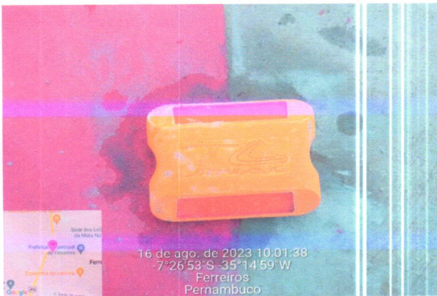
16 de ago. de 2023 10:01:38 -7°26'53" S -35°14'59" W Ferreiros Pernambuco