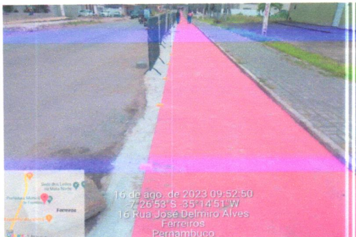
16 de ago. de 2023 09:52:50 -7°26'53" S -35°14'51" W 16 Rua José Delmiro Alves Ferreiros Pernambuco