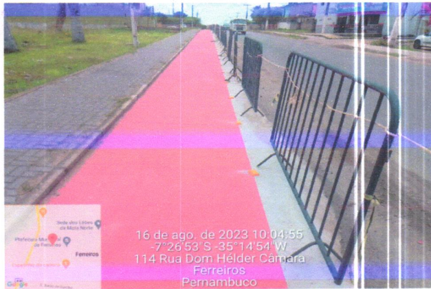
16 de ago. de 2023 10:04:55 -7°26'53" S -35°14'54" W 114 Rua Dom Hélder Câmara Ferreiros Pernambuco