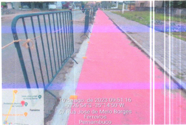
16 de ago. de 2023 09:51:16 -7°26'54" S -35°14'50" W 57 Rua José de Melo Borges Ferreiros Pernambuco