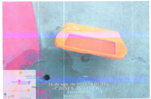
16 de ago. de 2023 10:01:31 -7°26'53" S -35°14'59" W Ferreiros Pernambuco