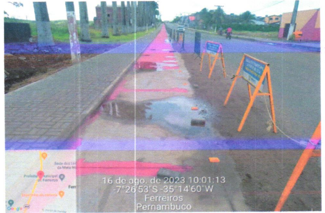
16 de ago. de 2023 10:01:13 -7°26'53" S -35°14'60" W Ferreiros Pernambuco